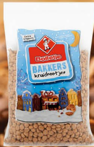
Bolletje 828085 | Bakkers kruidnoten 5kg. Inhoud 2 stuks