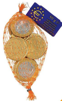
Hamlet 354101 | Euromunten 50gr. Inhoud 100 stuks