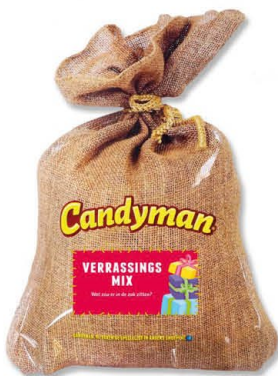
Candyman 225607 | Verrassingsmix jute zak 50gr. Inhoud 24 stuks