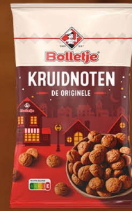
Bolletje 828006 | Kruidnoten (toonbankdoos) 100gr. Inhoud 24 stuks