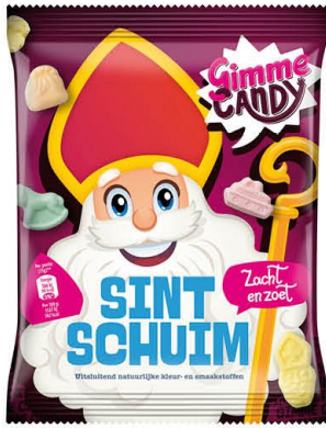
Gimme Candy 495567 | Sint Nicolaasschuim 200gr. Inhoud 30 stuks