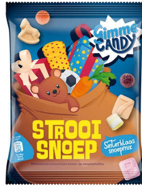
Gimme Candy 495568 | Strooisnoep 300gr. Inhoud 28 stuks