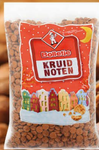
Bolletje 828095 | Kruidnoten 5kg. Inhoud 2 stuks