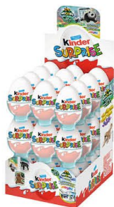
Kinder 209178 | Suprise ei Inhoud 36 stuks