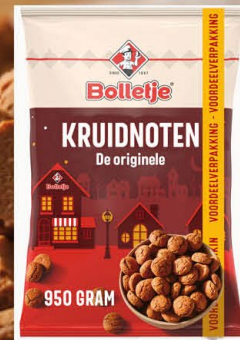
Bolletje 828096 | Kruidnoten 950gr. Inhoud 6 stuks