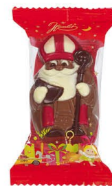
Hamlet 354103 | Sint 55gr. Inhoud 24 stuks