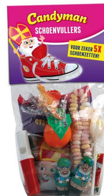
Candyman 17275 | Schoenvullers Inhoud 12 stuks