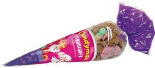
Candyman 225627 | Stroigoed 350gr. Inhoud 30 stuks