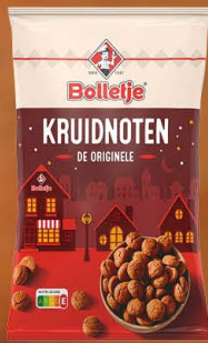
Bolletje 828093 | Kruidnoten (uitdeeldoos) 50gr. Inhoud 60 stuks