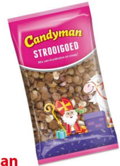
Candyman 225609 | Stroigoed 3kg. Inhoud 4 stuks