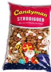
Candyman 225628 | Stroigoed 1kg. Inhoud 15 stuks